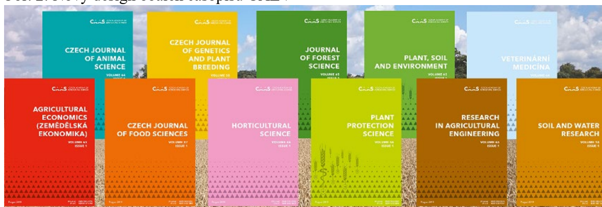
Obr. 2: Nový design obálek časopisů ČAZV