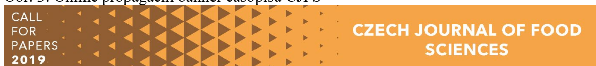
Obr. 3: Online propagační banner časopisu CJFS