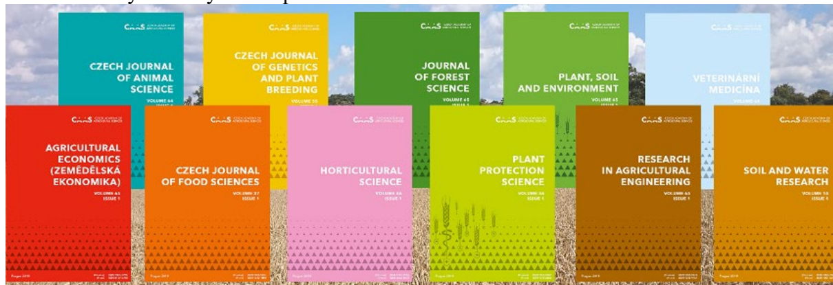
Obr. 2: Obálky vědeckých časopisů ČAZV

Webové prezentace časopisů byly upraveny v souladu s novou korporátní identitou ČAZV ( www.agriculturejournals.cz ). Došlo k zavedení sdílení publikovaných článků pomocí sociálních sítí (Facebook, Twitter, LinkedIn) a emailem mezi členy RR a členskou základnou ČAZV (mezi členy příslušného odboru, jehož předseda je garantem kvality časopisu). Dále byly zhotoveny reklamní bannery (pro propagaci online, Obr. 3 - ukázka časopis AgricEcon), které jsou redaktorkami využívány především v emailové komunikaci (součást podpisu):