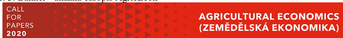
Obr. 3: Banner - ukázka časopis AgricEcon

Propagace jednotlivých časopisů ČAZV probíhá na Facebooku a LinkedIn. Stálá expozice časopisů ČAZV je umístěna v Objevovně Národního zemědělského muzea a v Knihovně Antonína Švehly. Časopisy byly v roce 2019 také propagovány na různých oborových akcích a konferencích (např.: konference Agrarian Perspectives XXVIII., Rostlinolékařské dny v Pardubicích, konference MendelNet 2019, konference Aktuální poznatky v pěstování, šlechtění, ochraně rostlin a zpracování produktů a akcích přímo organizovaných ČAZV).