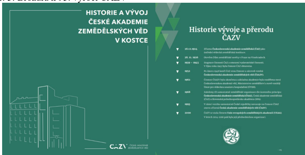
Obr. 5: Brožura k 95. výročí ČAZV