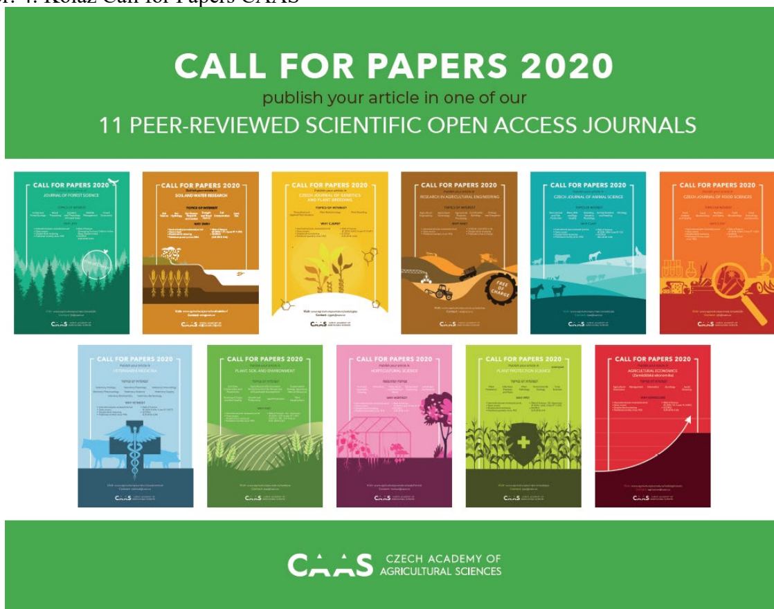
Obr. 4: Koláž Call for Papers CAAS