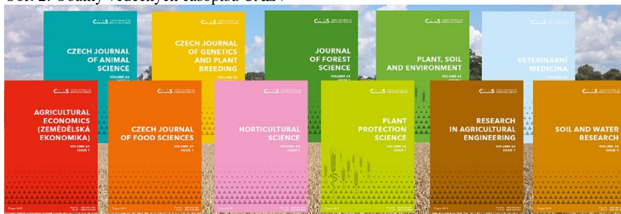
Obr. 2: Obálky vědeckých časopisů ČAZV

Webové prezentace časopisů i další propagační materiály byly upraveny v souladu s novou korporátní identitou ČAZV ( www.agriculturejournals.cz ). Došlo k zavedení sdílení publikovaných článků pomocí sociálních sítí (Facebook, Twitter, LinkedIn) a emailem mezi členy RR a členskou základnou ČAZV (mezi členy příslušného odboru, jehož předseda je garantem kvality časopisu). Dále byly zhotoveny reklamní bannery (pro propagaci online, Obr. 3 - ukázka časopis AgricEcon), které jsou redaktorkami využívány především v emailové komunikaci (součást podpisu):