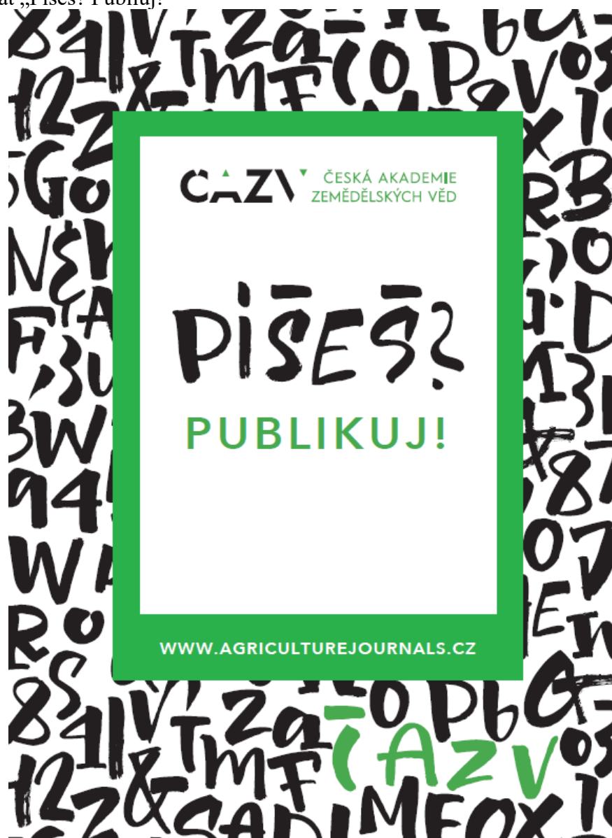
Obr. 8: Plakát „Píšeš? Publiuj!“