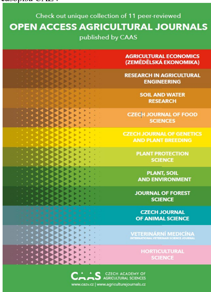
Obr. 7: Hrací karty „Černý Petr“ s motivy časopisů ČAZV a zemědělských oborů