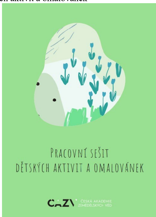
Obr. 7: Pracovní sešit dětských aktivit a omalovánek