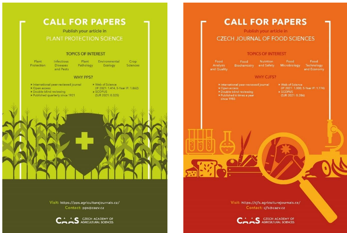
Obr. 5: Ukázka z DL skládacího letáku o ČAZV a vydavatelské činnosti