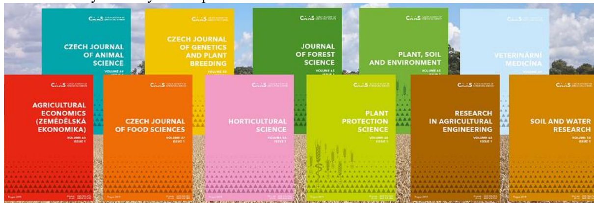
Obr. 2: Obálky vědeckých časopisů ČAZV

Všechny časopisy jsou prezentovány na webových stránkách www.agriculturejournals.cz . Zároveň má každý z časopisů svou vlastní webovou prezentaci a webové stránky se zkratkou názvu časopisu. Např.: časopis Agriculture Economics (AGRICECON) má své webové stránky www.agricecon.agriculturejournals.cz . Došlo ke sladění grafické i obsahové prezentace na webových stránkách všech časopisů.