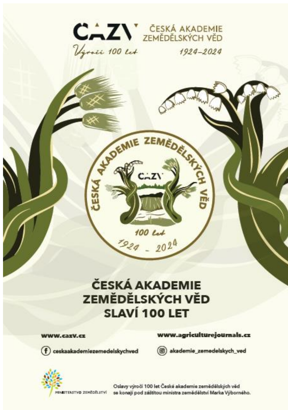
Obr. 9: Plakát k výročí 100 let ČAZV v roce 2024

ČAZV ČESKÁ AKADEMIE ZEMĚDĚLSKÝCH VĚD Výročí 100 let 1924-2024