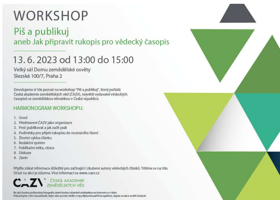
Obr. 7: Pozvánka na workshop ČAZV „Piš a publikuj“