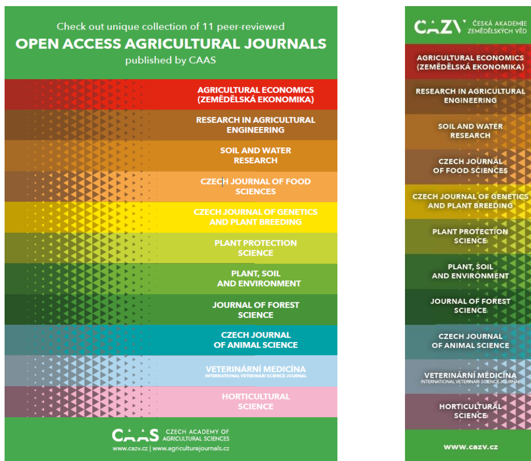
Obr. 6: Plakát bannerů časopisů ČAZV a záložka do knihy